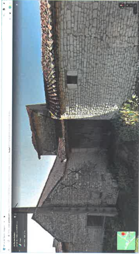
Puit de la Chambodière (photo à actualiser)