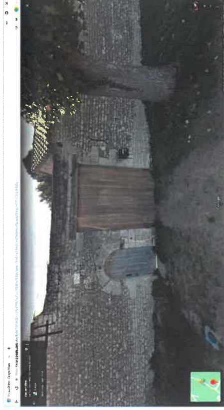
15. Porche Rue des Sables – 8 rue des Sables : C121